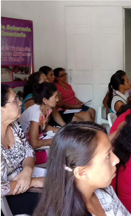
Mujeres socias de Codimca. Las Flores, Lempira.