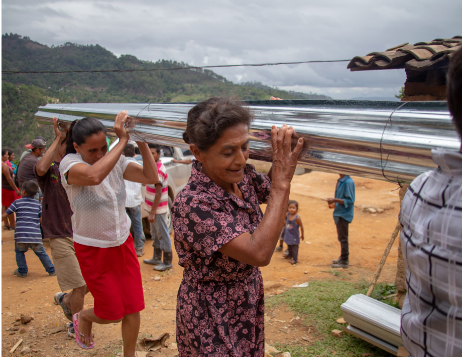
Grupo de mujeres Las Cascadas, de la comunidad de cedros de Mejjicapa Gracias Lempira. Iniciativa Económica IE: Centro avícola de pollo de engorde.

118 mujeres (46 mujeres jóvenes, 72 adultas; 12 mujeres garífunas, y 106 mujeres lencas diseñaron sus planes de negocios y llevaron a cabo su implementación.