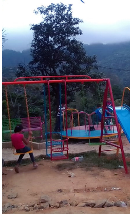
Trabajando en la instalación de la iniciativa de cuidado moliendo y cuidando. Foto: Martín Cálix (Foto de la izquierda)