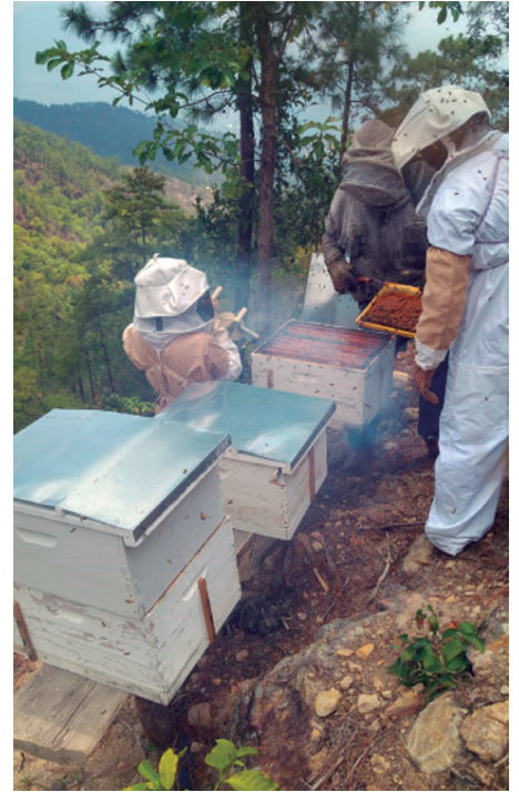
Empresa de Servicios Múltiples Acción Femenina en Marcha, Apiario envasado y venta de miel.

Ahora estamos felices de haber escogido un proyecto tan chulo como el de las colmenas.