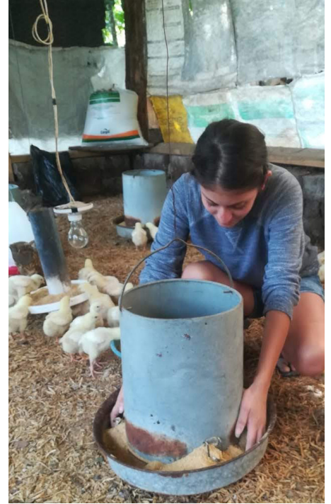
Grupo Base de Mujeres en Marcha, Iniciativa Económica. Centro avícola de gallinas ponedoras.

Vimos que podíamos hacer otro tipo de actividades, una de nosotras puso a disposición del grupo un terreno para cultivo, decidimos que sembraríamos frijoles, tomamos la decisión entre todas, que para comprar los insumos para la siembra tomaríamos prestado de los ahorros generados por la crianza de gallinas y lo regresaríamos cuando cosecháramos los frijoles, ahora contamos con nuestro galpón y tenemos una parcela de frijoles, estamos a la espera de la cosecha, confiando que nos irá bien.